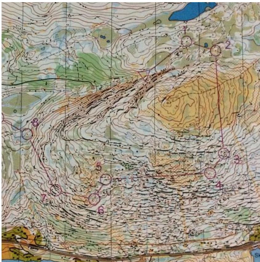
Karta från första dagen av Midnattsolsgaloppen

Ett gäng IFK:are tog sig en sväng till Midnattsolsgaloppen (MG), som i år gick i trakterna kring Tromsö. En mycket fin och uppskattad tävling där man får springa på högkvalitativa kartor i minst sagt fantastiskt nordnorsk fjällterräng. MG var i år som vanligt en morsom upplevelse. Nästa gång MG arrangeras är 2019.